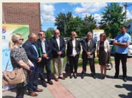
Predstavnici REGEA-e na otvorenju

REGEA Organiziran sajam obnovljivih izvora energije i opreme