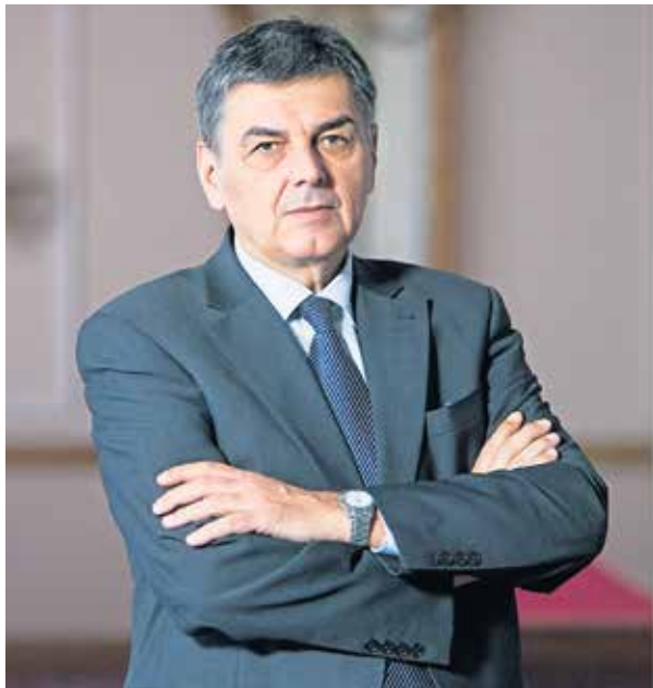
Vladimir Šišljagić, župan Osječko-baranjske županije PD

Općine i gradovi koji imaju kvalitetnu komunalnu i društvenu infrastrukturu lakše stvaraju pozitivno okruženje u komu i mladi nalaze mogućnosti za zapošljavanje te za primjeren životni standard, što ujedno znači i njihov ostanak u ruralnom prostoru. Uz to, Županija potiče i pomaže poduzetničke inicijative te omogućava edukacije. Na primjer, razvijanjem ruralnog turizma želimo omogućiti i mladima da