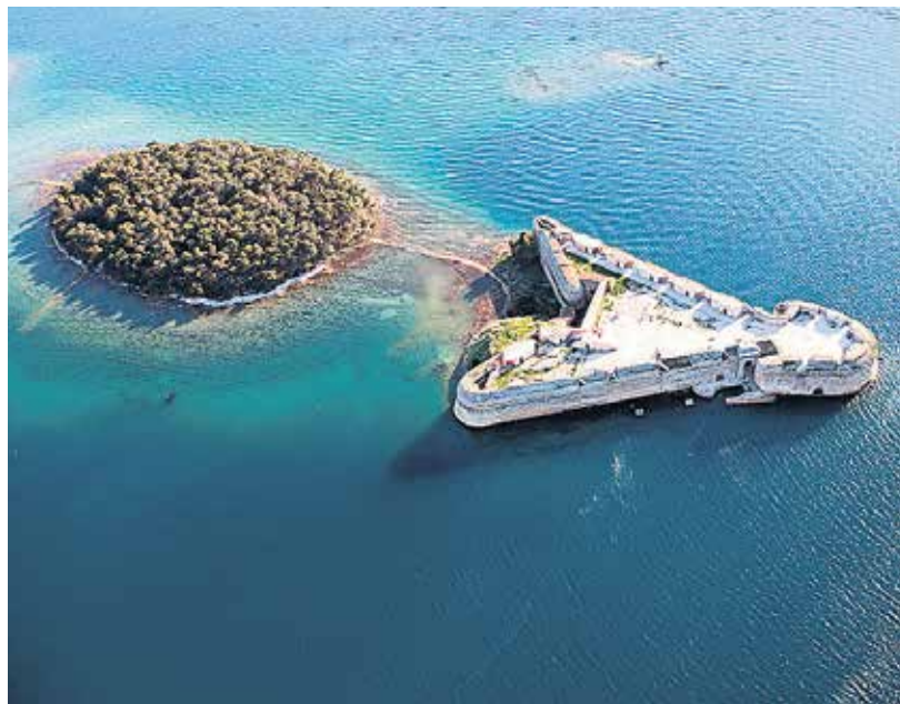
Tvrđava je smještena na otočiću Ljuljevcu, na ulazu u kanal sv. Ante

Šibensko-kninska županija i Javna ustanova PRIRODA Šibensko-kninske županije zajedničkim snagama do sada su odradili veliki dio pripreme projektne dokumentacije za početak radova na tvrđavi sv. Nikole. Za projektnu dokumentaciju Županija je iz svog izvornog proračuna u 2014. godini izdvojila 170 tisuća kuna, a u 2015. za projektnu dokumentaciju i radove 1.230.000 kuna. Nakon izrađene opsežne dokumentacije u prosincu prošle godine počeli su pripremni radovi na uređenju tvrđave sv. Nikole. Tvrtka Marinaprojekt i arhitekt Nikola Bašić izradili su Programске smjernice za obnovu tvrđave sv. Nikole. Svrha ovog dokumenta je utvrđivanje upravo takvog programa obnove tvrđave koji osim mjera zaštite i restauracije predviđa i scenarije budućeg korištenja, što uključuje i prihvat novih funkcija. Osnovna teza je da svi zahvati i in-