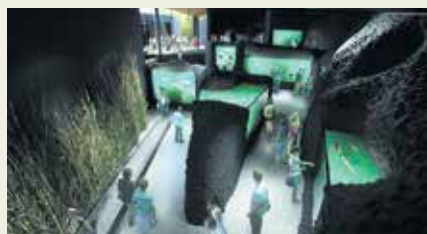
Kompleks akvarijskih bazena

premle su projekt od projektne ideje do završne dokumentacije koji je odobren u sklopu 4. poziva Sheme dodjele bespovratnih sredstava za poslovnu infrastrukturu u okviru Operativnog programa Regionalna konkurentnost 2007. - 2013. Vrijednost projekta je 36.691.939 kuna, od čega je 36.222.282 kuna sufinancirano sredstvima iz EU fondova. ♦