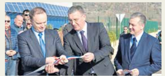
Župan Zlatko Ževrnja i ministar Darko Horvat

Nakon završne konferencije projekta 'PZ Čaporice – centar agropoduzetništva 3LJ' u samoj zoni svečano je otvorena i 'Zona Čaporice – zapad'. Sudionicima konferencije na svečanosti otvaranja pridružili su se i novi ministar obrta i poduzetništva Darko Horvat i potpredsjednik Hrvatskog sabora Ante Sanader. Prilikom svečanog otvaranja prisutnima se obratio Splitsko-dalmatinski župan Zlatko Ževrnja. "Danas obilježavamo završetak europskog projekta teškog oko 15 milijuna i 200 tisuća kuna na kojem su radili Grad Trilj i naša razvojna agencija RERA. Uspješno su privukli ta sredstva i na to smo zaista ponosni. Tim sredstvima se izgradila dodatna faza ove poduzetničke zone kojom se omogućuje izgradnja agropoduzetničkog centra", kazao je Ževrnja.