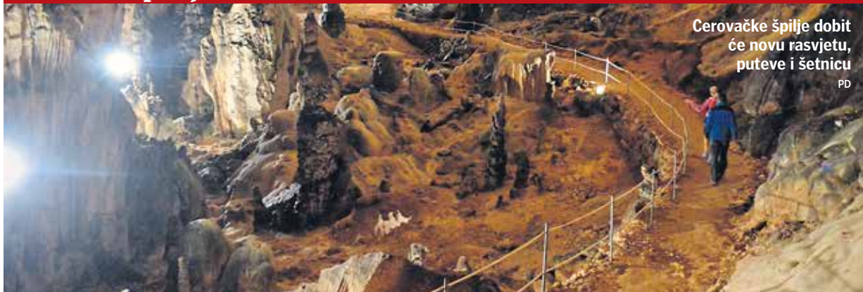
Cerovačke špilje dobile novu rasvjetu, puteve i šetnicu. PD