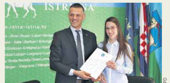
Župan Flego povećao je broj stipendista za 80%

Istarski župan Valter Flego primio je stipendiste Istarske županije s kojima je potpisao ugovore o dodjeli stipendija za akademsku godinu 2015./2016. Župan Flego je naglasio kako usprkos dugogodišnjoj gospodarskoj krizi te značajnom smanjenju proračunskih prihoda, Istarska županija nije smanjivala mjesečni iznos stipendija, te on od akademske godine 2010./2011. iznosi 1100 kuna, "Štoviše, u 2013. povećao sam broj primatelja stipendija za 30 posto, s 30 na 40 stipendija, te uveo dodatnih 20 stipendija namijenjenih nadarenim studentima slabijeg imovnog stanja", istaknuo je župan dodajući kako je od početka njegovog mandata broj stipendista povećan za 80 posto. "Ulaganje u znanje je investicija koja će se višestruko vratiti, stoga će Županija i ubuduće biti usmjerena na ulaganje u mlade i obrazovanje", zaključio je župan Flego.