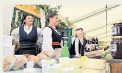
Uspostava sustava kvalitete "Lika quality" PD

Inicijativa Pokrenut je proces zaštite sira oznakom zemljopisnog podrijetla