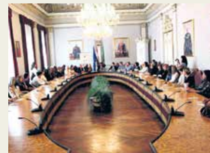
Završna konferencija projekta

Projekt 'Obrazujmo se zajedno II' sufinanciran je sredstvima Europske unije, Europskog socijalnog fonda, Operativnog programa 'Učinkoviti ljudski potencija-