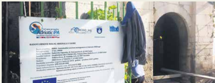
Radovi na fasadi i krovu su gotovi, a trenutno se izvode unutarnji radovi

U okviru predmetnih radova postavljaju se staklene plohe koje će služiti kao medij za multimedijalne projekcije, saniraju podovi objekta s postavljanjem staklenih površina za prolaznike i ostali potrebni radovi", pojasnio je Hrvoje Grančarić iz Upravnog odjela za razvoj i europske procese Zadarske županije. ❖