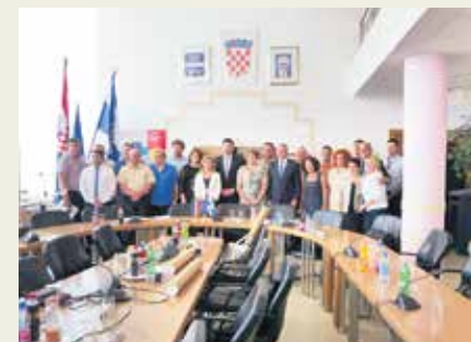
Ministar Kušćević u posjeti Županiji

Povodom potpisivanja odluka za radove energetske obnove za pet škola s područja Brodsko-posavske županije, čije financiranje je odlukama odobrilo Ministarstvo graditeljstva i prostornoga uređenja, dodijele odluka o dodjeli sred-