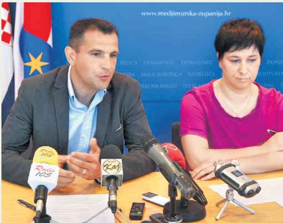
Međimurski župan Matija Posavec predstavio je nove potpore

Naša je odgovornost da lokalnom gospodarstvu omogućimo lakše kandidiranje i odobravanje traženih sredstava”, objasnio je župan Međimurske županije Matija Posavec na predstavljanju ovog poticaja međimurskom gospodarstvu i dodao kako će se osmišljavanjem ovog projek-